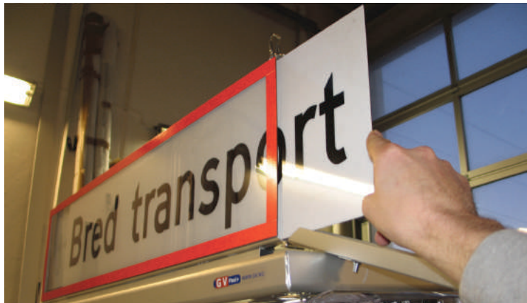
Enkelt bytte av budskap